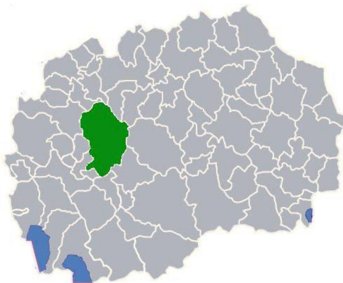
Слика 1 Општина Македонски Брод

Општина Македонски Брод со површина од 888км 2 , го зафаќа средното течение на реката Треска, западно од планинскиот масив Јакупица, целосно ја зафаќа областа Поречје и се протега на југ до Бушева Планина, на запад до Коњарник и Добра Вода, на север до Сува Гора и на исток до Караџица, Јакупица и Даутица. На територијата на општината има неколку маркантни планини: Јакупица, Караџица, Сува Гора, Добра Вода и Бушева Планина со Баба Сач. Релјефот на општината е сочинет од голем број речни текови од кои најзначајна е реката Треска. Оваа река во своето течение од селото Ореовец па до Македонски Брод, во должина од 4км има кањонски изглед.