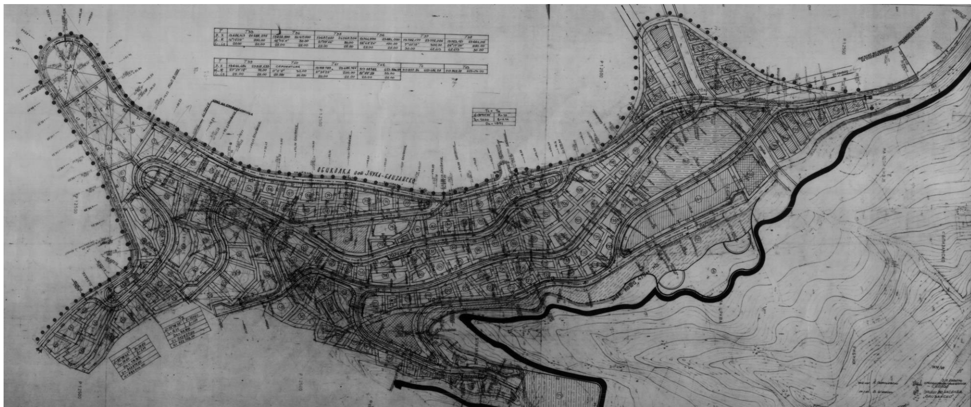
Викенд зона Близанско