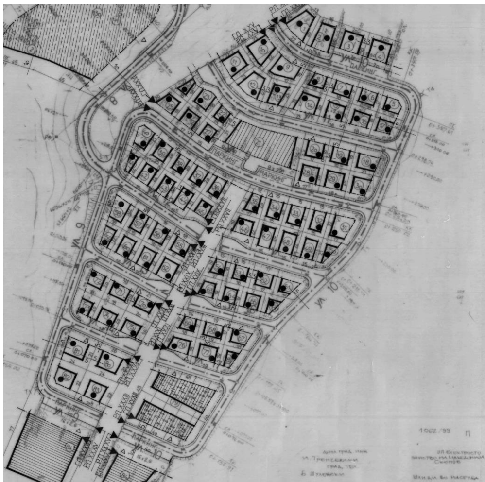
Викенд зона Здуње