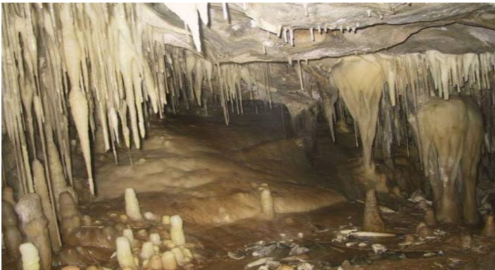
Дел од внатрешноста на Слатински извор