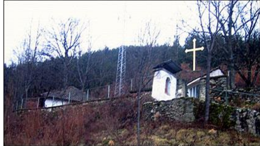
Св.Никола – Турбе